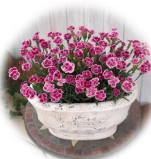
ナデシコなどは夏の花なのです。